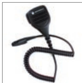
MDPMMN4023 Zewnętrzny mikrofonogłośnik wodoszczelny (spełnia normę IP57)