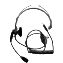
NMN6245 Lekki zestaw nagłowny z mikrofonem i PTT