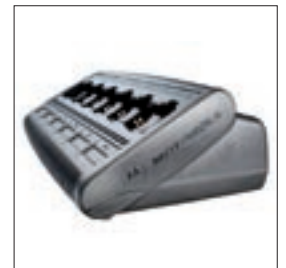
WPLN4189 Ładowarka wielostanowiskowa z wtyczką Euro