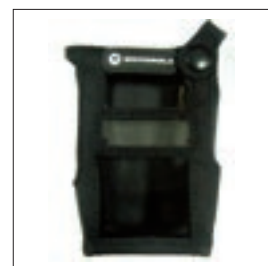
PMLN5089 Pokrowiec nylonowy dla radiotelefonów wodoszczelnych z wyświetlaczem