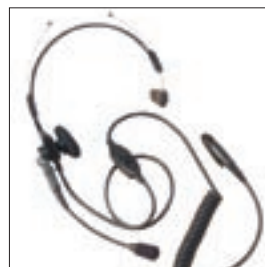
MDJMMN4066 Lekki zestaw nagłowny z mikrofonem i PTT