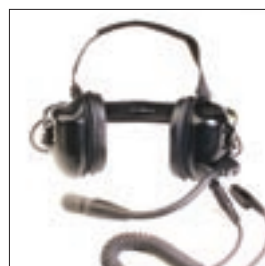
BDN6645 Zestaw nagłowny z PTT do pracy w trudnych warunkach