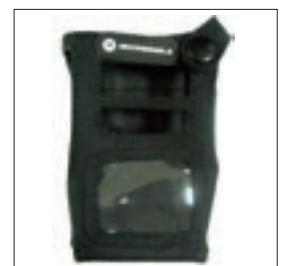
PMLN5090 Pokrowiec nylonowy dla radiotelefonów wodoszczelnych bez wyświetlacza