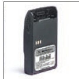
PMNN4074 Wodoodporna bateria Li-Ion (spełnia normę IP57)

Dobra, naładowana bateria jest krytycznym elementem determinującym wykorzystanie radiotelefonu. Radiotelefony serii GP-R pracują z bateriami litowo-jonowymi w wykonaniu standardowym albo iskrobezpiecznym (FM). Dostępne są ładowarki pojedyncze i wielostanowiskowe.